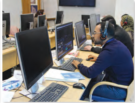
المونتاج التلفزيوني NL Editing for TV Production