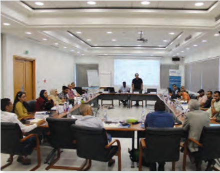
أمن المعلومات Cyber Security