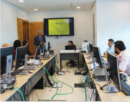
الغرافيك لإنتاج الهوية البصرية وشارات البرامج التلفزيونية Branding Using Graphics