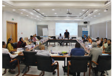
قاعة متعدّدة الإختصاصات

تسعى أكاديمية التدريب إلى توسيع رقعة إشعاعها وإحكام الإعلام حول نشاطاتها، وذلك باستعمال المسالك التقليدية في الإعلام (مراسلات الهيئات الأعضاء) مع دعمها بالطرق العصرية للتواصل والتسويق : مواقع الواب للاتحاد (ركن الأكاديمية) وصفحاتها على الشبكات الاجتماعية (Facebook و Twitter) التي تغطي النشاطات المنجزة وتعلن عن الدورات القادمة.