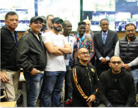
الإخراج المباشر للظواهر الرياضية Sports Live Direction