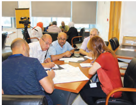
بناء قدرات الموارد البشرية Team Building in Human Resources