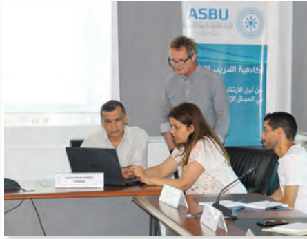
إستراتيجية رقمنة ومعالجة الأرشيف السمعي البصري Digitization & Management Strategy of Audiovisual Archives