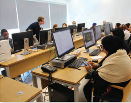
الفيديوهات الفيروسية Viral Videos