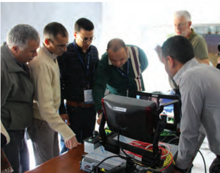
تكنولوجيا وتشغيل الكاميرات عالية الدقة Mastering HD Cameras