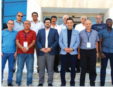
تدريب المدربين Training of Trainers