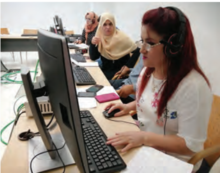
الكتابة للصورة الخبرية Writing for News Pictures