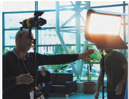
تشكيل المشاهد الإبداعية باستخدام الإضاءة الخارجية Portable Documentary Lighting