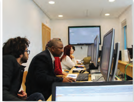
صحافة البيانات Data Journalism